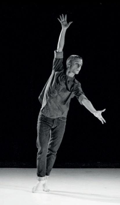
Pol Pi