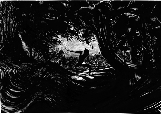
Oltremai , dessins à l'encre de Chine © Lorenzo Mattotti